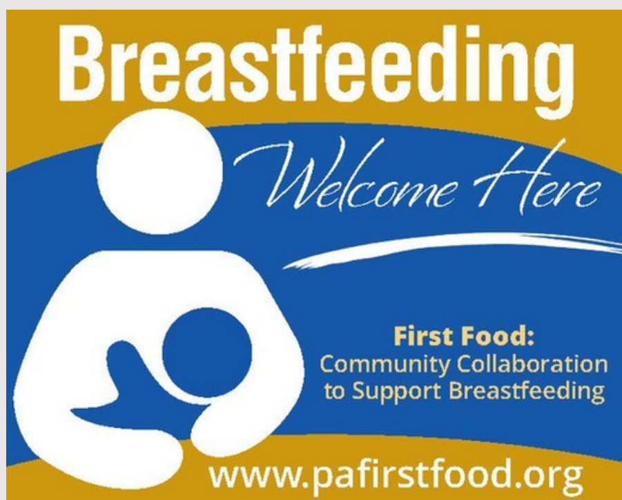
Adhesivo de Ventana 4in x 5in