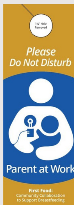
El frente del colgador de puerta