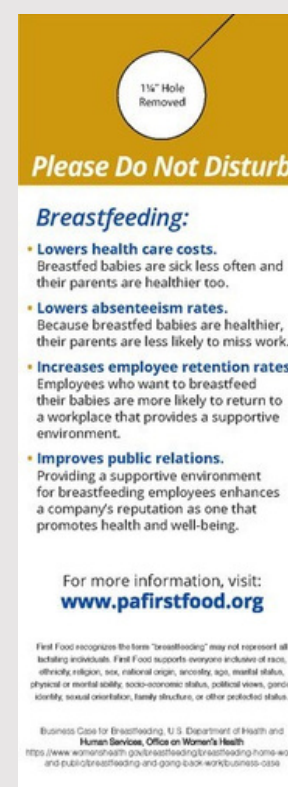
La parte atrás del colgador de puerta

Para ordenar, por favor env íe un mensaje a breastfeeding@paaap.org